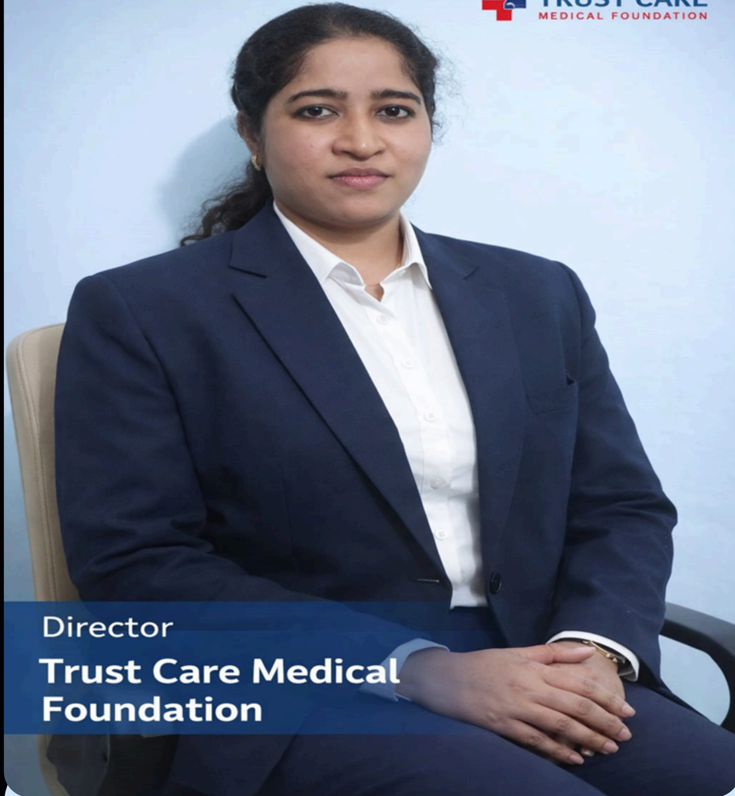
Director Trust Care Medical Foundation